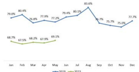
LOAD FACTOR OF CHINA INTER FLIGHTS