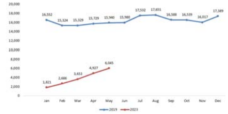
AIR SEAT CAPACITY OF CHINA INTER FLIGHTS