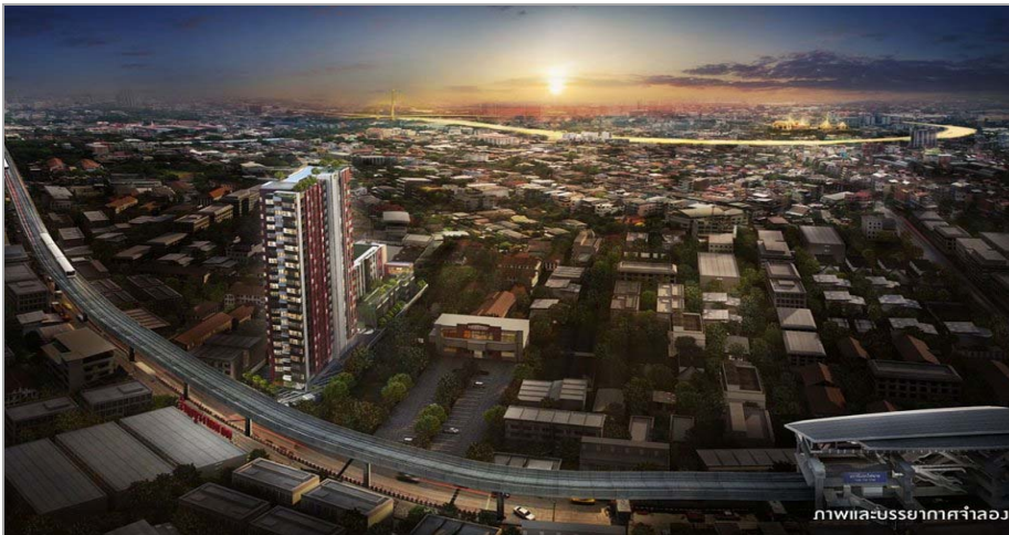
ภาพและบรรยากาศจำลอง